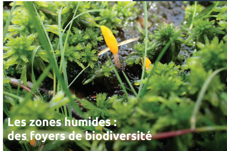
Les zones humides : des foyers de biodiversité

Le but du réseau est de permettre des échanges d'informations entre les adhérents et les animateurs du Conservatoire sur la connaissance des milieux naturels et les pratiques de gestion adaptées. Un diagnostic écologique des zones humides est ainsi réalisé de manière concertée chez chaque adhérent afin de mieux comprendre le fonctionnement hydrologique et la richesse biologique de chacune d'elles. Des pratiques de gestion sont ensuite proposées en tenant compte à la fois de la préservation des milieux et de l'activité économique de l'adhérent quand elle existe. Chacun est libre de les mettre en pratique ou non. Les animateurs assurent un suivi des parcelles humides conventionnées.