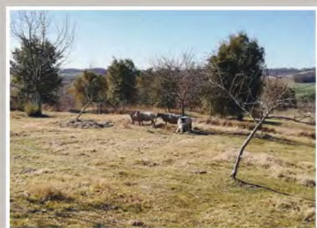
Pâturage ovin au Maine Long (Brie-sous-Chalais)