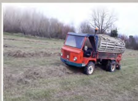
Entretien mécanique au Maine Augeais (Ronsenac)