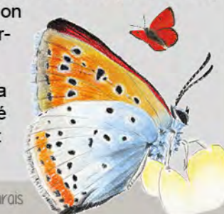
Cuivré des marais

Ce suivi a également permis de confirmer la présence du Damier de la Succise et du Cuivré des marais sur Chez Verdu, tous deux d'intérêt communautaire.