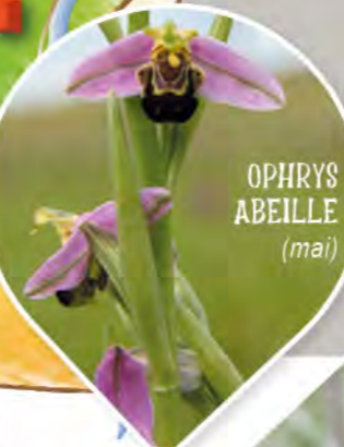
OPHRYS ABEILLE (mai)