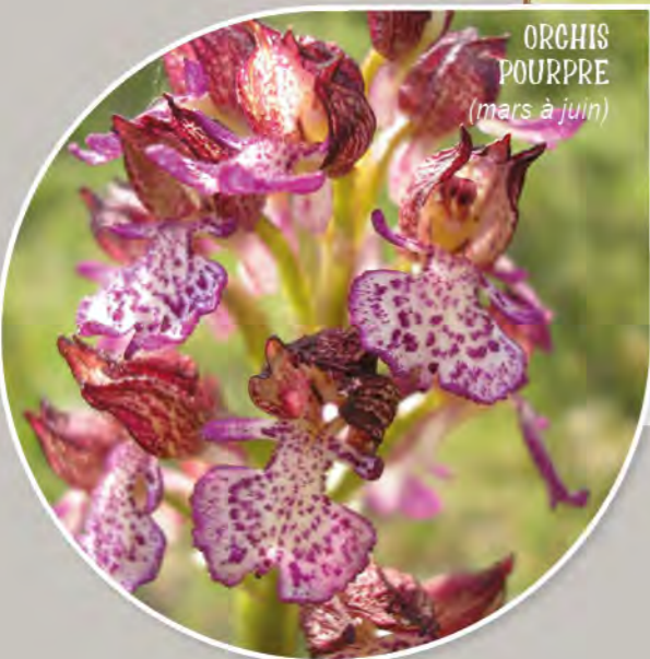
ORCHIS POURPRE (mars à juin)

Berneuil se caractérise par ses coteaux culminant à plus de 160 mètres, le long de la vallée de la Maury.