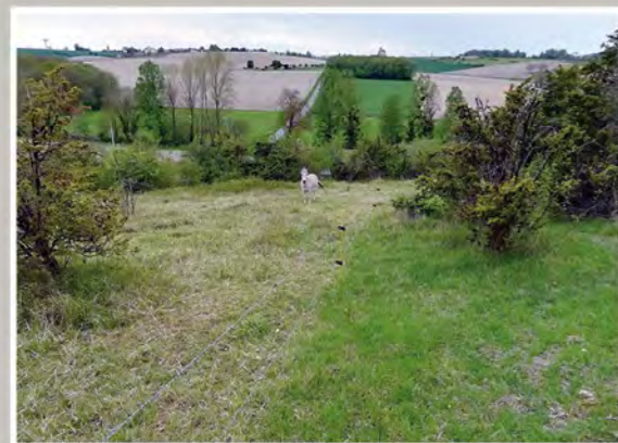
Pâturage asin au Pont du Maçon (Berneuil)

Ces 3 dernières années, réouverture de milieux, entretien, pâturage se sont déroulés sur les coteaux du montmorélien :