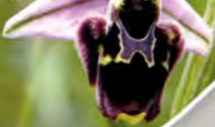
OPHRYS BÉCASSE (avril-mai)