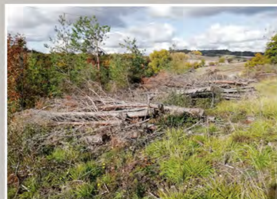
Exploitation de pinèdes au Moulin de Batraud (Ronsenac)