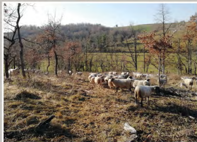
Pâturage au Faix de Nèreau (Châtignac)