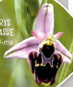
OPHRYS BÉCASSE (avril-mai)