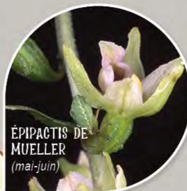
ÉPIPACTIS DE MUELLER (mai-juin)

Surplombant la vallée de la Lizonne, ce circuit vous amène au sommet de Puyrateau. Chemins creux et vue panoramique sur la Dordogne sont au rendez-vous. Près des chênes, découvrez l'Épipactis de Mueller.