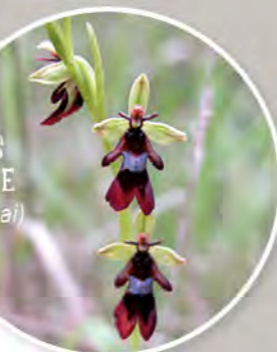
OPHRYS MOUCHE (avril-mai)