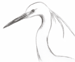
Aigrette garzette

Inscription obligatoire : Alionka Boiché 05 59 70 58 37 - a.boiche@cen-na.org