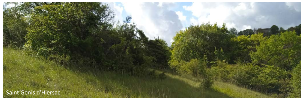
Saint Genis d'Hiersac