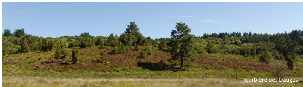
Tourbière des Dauges

Inscription obligatoire : Virginie Blot 06 52 27 34 70 - v.blot@cen-na.org En partenariat avec la mairie de Janailhac, Janailhac patrimoine