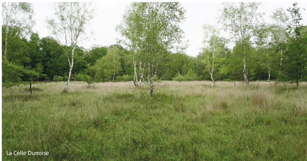
La Celle Dunoise

Inscription obligatoire : Julien Jemin 06 89 55 65 17 - j.jemin@cen-na.org