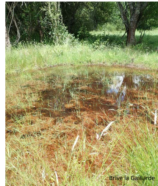
Brive la Gaillarde

Inscription obligatoire : Olivier Rasclé 05 55 03 09 09 - o.rasclé@cen-na.org