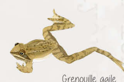
Grenouille agile