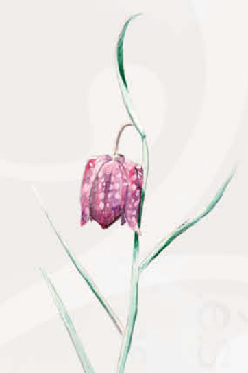
Fritillaire pintade

Disponible sur le site internet du Conservatoire www.cen-nouvelle-aquitaine.org Documentation : dépliants, lettres d'information, etc.