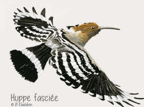
Huppe fasciée