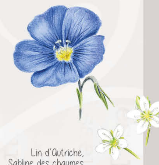
Lin d'Outriche, Sabline des chaumes