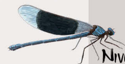
Caloptéryx éclatant

Les arrêtés préfectoraux de protection de biotope (APPB) L'APPB est une protection réglementaire visant à préserver les habitats d'espèces animales et végétales protégées. Des règles s'appliquent sur ces sites, merci de vous référer aux panneaux à l'entrée.