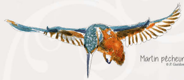
Martin pêcheur

Pelouses sèches, marais On peut l'apercevoir l'été