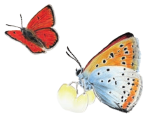
Cuivré des marais