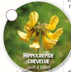
HIPPOCRÉVIDE CHEVELUE (avril à juillet)