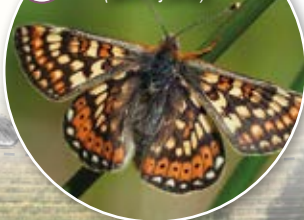
DAMIÈRE DE LA SUCCISE (avril à juillet)

On y observe différents faciès de végétation répartis en mosaïque (pelouse sèches, landes à genévriers, fourrés arbustifs et boisements thermophiles). Ces habitats, peu communs en Gironde, sont propices au développement d'espèces végétales rares comme l'Orchis à odeur de vanille ( Anacamptis fragrans ) ou encore d'espèces animales remarquables comme le Damier de la Succise ( Euphydryas aurinia ) protégé nationalement.