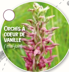
ORCHIS À ODEUR DE VANILLE (mai-juin)