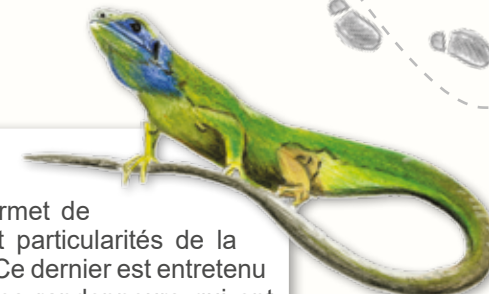
LÉZARD VERT

La Butte de la Lot a été classée site prioritaire dans le cadre de l'inventaire des pelouses sèches du département réalisé par le Conservatoire entre 2001 et 2003. Les négociations foncières qui ont suivi cette phase d'étude ont permis l'acquisition en 2006 de 1,3 hectare. Après différentes acquisitions et conventionnement avec des propriétaires privés le Conservatoire a pu obtenir une maîtrise d'usage sur plus de 50 % de la surface totale du site.