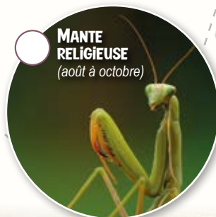
MANTE RELIGIEUSE (août à octobre)