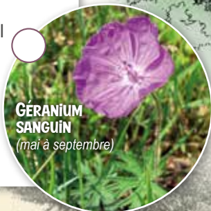
GÉRANIUM SANGUIN (mai à septembre)