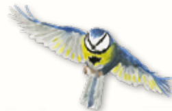
MÉSANGE BLEUE

Lors de votre balade, observez et amusez-vous à reconnaître les espèces suivantes !