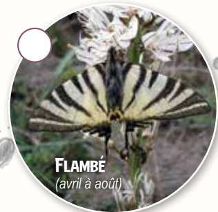
FLAMBÉ (avril à août)