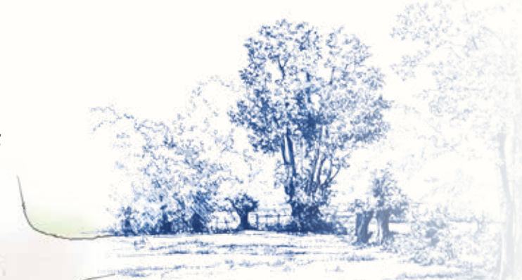
ARBRES TÊTARDS