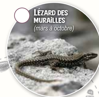
LÉZARD DES MURAILLES (mars à octobre)