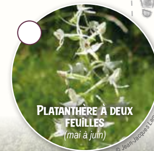
PLATANTHÈRE À DEUX FEUILLES (mai à juin)