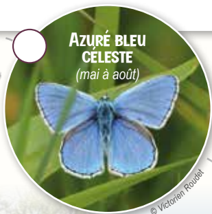
AZURÉ BLEU CELESTE (mai à août)

Situés au sein du plateau de Lascrozes, dans le Villeneuveois, les 11 ha du coteau de Castelmerle dominant la vallée du Lot et possèdent un attrait paysager certain avec leur mosaïque d'habitat : pelouses sèches, landes, fruticées, boisements de Chênes pubescents et de Chênes verts. Ces habitats diversifiés favorisent la présence d'une biodiversité riche et remarquable en Lot-et-Garonne. Le sentier de 1 km permet de découvrir toutes les richesses et particularités de ces formations calcaires sur lesquelles se développent les pelouses sèches.