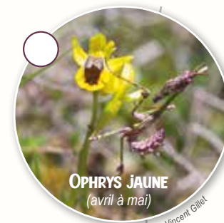
OPHRYS JAUNE (avril à mai)