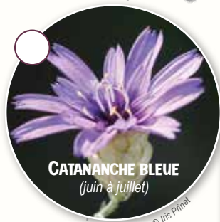
CATANANCHE BLEUE (juin à juillet)