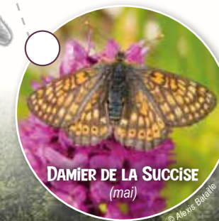
DAMIER DE LA SUCCISE (mai)

Le CEN Nouvelle-Aquitaine, propriétaire du site, s'est donné pour objectif de gestion de restaurer et conserver les pelouses sèches par des actions de réouverture de milieux et de fauche ou de pâturage extensif en période propice, tout en maintenant une bonne mosaïque d'habitats. Ces actions profiteront ainsi indéniablement aux espèces associées à ces milieux, et indirectement à la biodiversité ordinaire aussi !