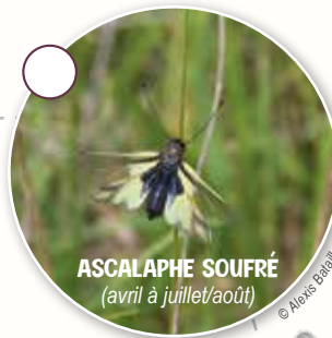
ASCALAPHE SOUFRÉ (avril à juillet/août)