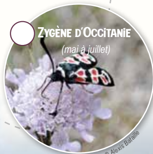
ZYÈNE D'OCCITANIE (mai à juillet)