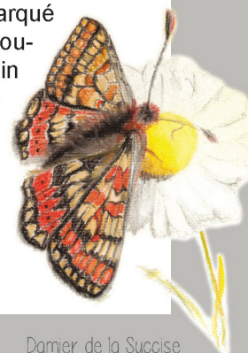
Damier de la Succise