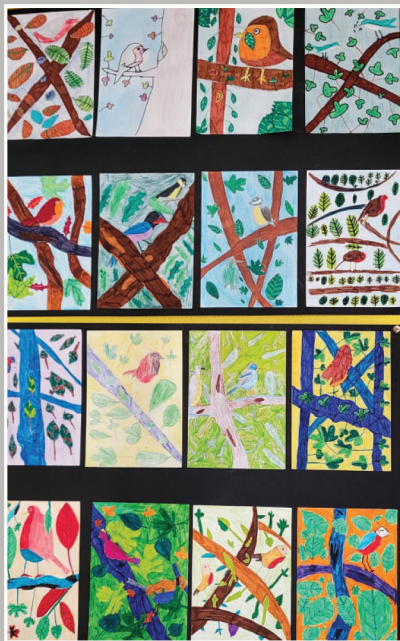
La Fauvette pitchou dans ses brandes, vue par les élèves de l'école André Rossignol de Montmorillon

En 2021, des animations auprès de deux classes de l'école André Rossignol de Montmorillon ont été réalisées par la LPO. Les élèves ont étudié en classe les milieux naturels tels que la Brande du Poitou, puis ils sont sortis dans les Landes de Sainte-Marie pour observer les plantes et les animaux qui vivent dans les brandes. Ils ont réalisé des dessins, les CM1/CM2 ont notamment dessiné les oiseaux qui font leurs nids dans les brins de Bruyère à balais, telle que la Fauvette pitchou.