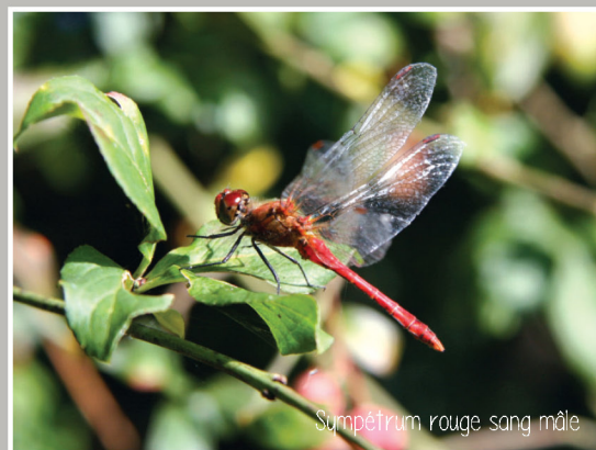
Sympétrum rouge sang mâle

Toutes ces animations ont été réalisées dans le cadre du volet sensibilisation de la mission d'animation du Docob Natura 2000 confiée au CEN Nouvelle-Aquitaine par la DDT de la Vienne.