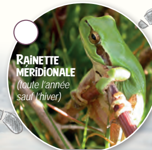
RAINETTE MÉRIDIIONALE (toute l'année sauf l'hiver)