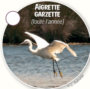
AIGRETTE GARZETTE (toute l'année)