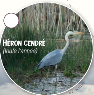
HÉRON CENDRÉ (toute l'année) © E. Hollob