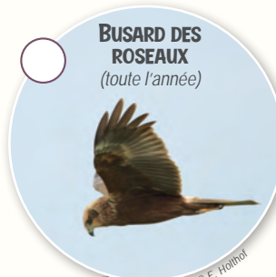
BUSARD DES ROSEAUX (toute l'année)