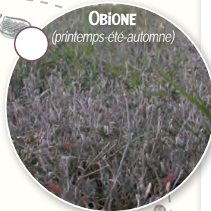
OBIONE (printemps-été-automne)