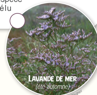
LAVANDE DE MER (été-automne)