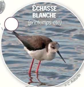
ÉCHASSE BLANCHE (printemps-été)

Les tamaris poussent uniquement dans ces milieux salés et bordent un chemin menant au moulin le long duquel se distinguent Hérons cendrés, Aigrettes, Busards des roseaux ou encore, au crépuscule, les Murins de Daubenton, une espèce de chauve-souris ayant élu domicile dans le moulin.