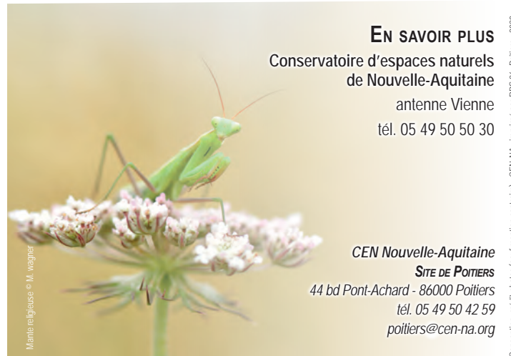
Mante religieuse